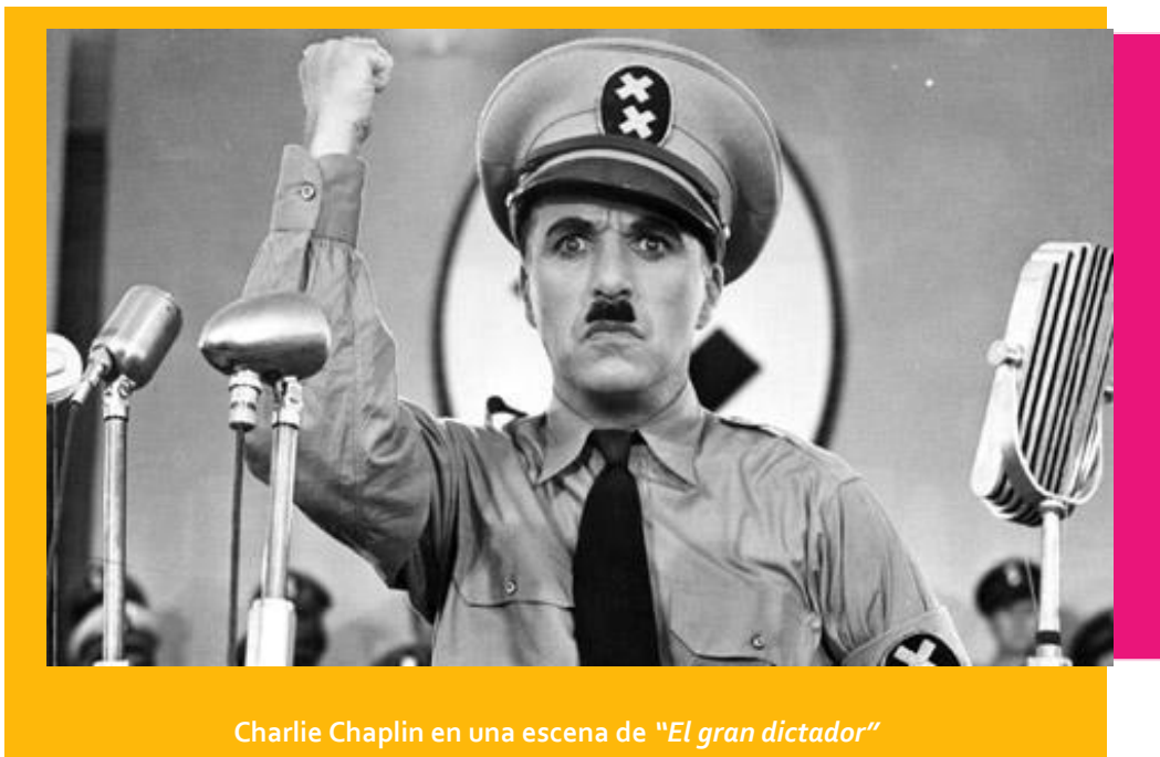
Charlie Chaplin en una escena de "El gran dictador"