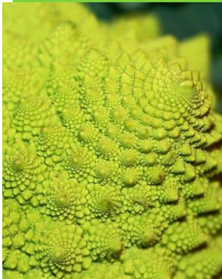
Un fractal es un objeto cuya estructura se repite una y otra vez a diferentes escalas, tal como la cultura política

Una idea que resulta muy ilustrativa para esta reflexión es comparar la cultura política con las figuras de los fractales. Un fractal es un objeto cuya estructura se repite una y otra vez a diferentes escalas, de manera que el objeto completo tiene la misma forma que la más pequeña de sus partes. Encontramos muchas de estas figuras en la naturaleza y en representaciones gráficas de modelos matemáticos. Igualmente, nuestra comunidad política de más grande escala –el Estado– compartirá las mismas características que las comunidades políticas menores: los partidos políticos, las organizaciones sociales, las empresas, los centros educativos, la familia.